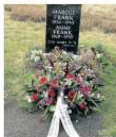
Am Leidenstein für Anne und Margot Frank stehen die Schüler aus Borne und Rheine einer Kiste voller Kerzen.

„Wir lernen nicht nur aus der Vergangenheit, sondern auch aus der Gegenwart, um die Zukunft zu gestalten.“