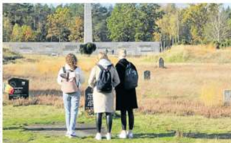
Im schillernden Licht der Sonne besuch die ehemaligen Partnerstadtler und die heutigen Borneaner-Gedenkstätten Bergen-Belsen am Niederländischen und deutschen SchülerInnen, um den Gedenken hier erst zu gehen.

Die Schüler und die Begleiter vor einem der Wägen, mit denen die Menschen damals ins Konzentrationslager Bergen-Belsen gebracht wurden.