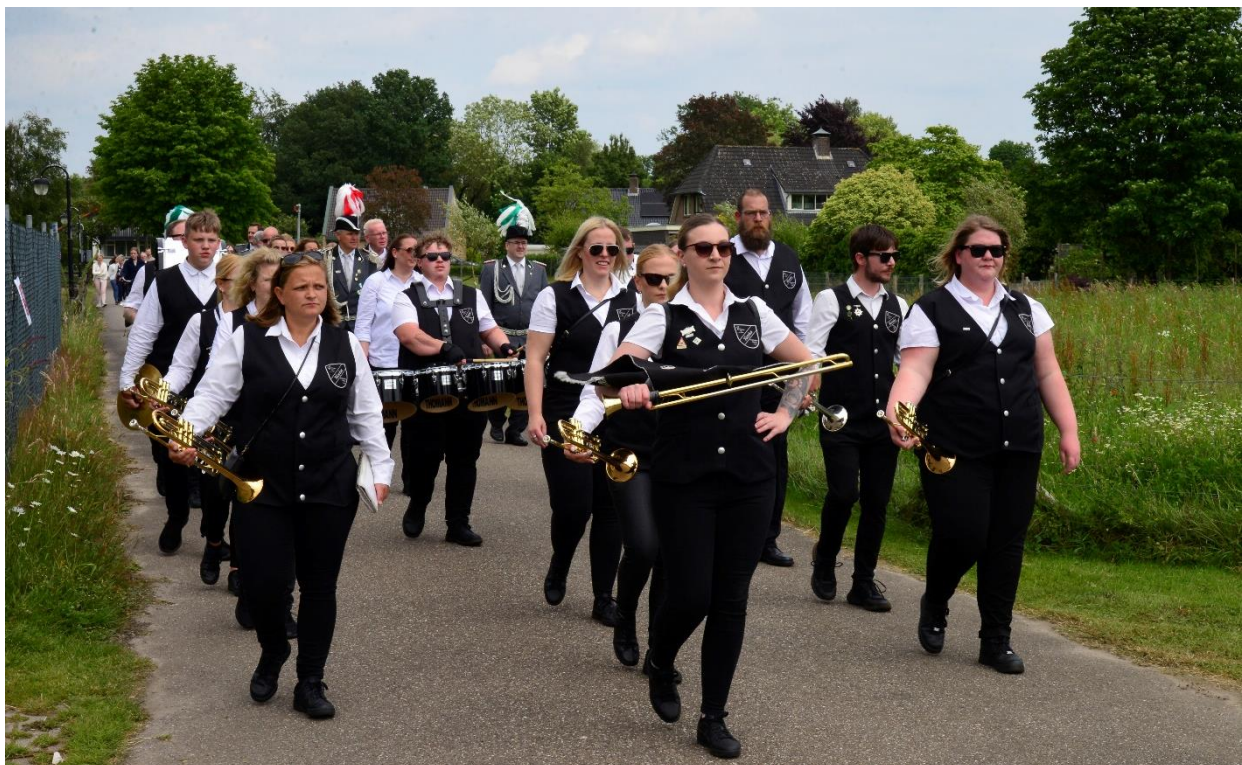
De Fanfarezug van schuttersvereniging Aloysius Kiebitzheide Rheine en het Stadtkaiserpar uit Rheine

In Rheine wordt er in het 1 e weekend van de maand september door de koningen en laatste oud-koningen van alle schuttersverenigingen uit Rheine geschoten om de titel Stadtkaiser van Rheine. De Kreis Rheine kent zo'n 28 schuttersverenigingen en hierdoor nemen er zo'n kleine 60 koningen deel aan dit schieten om de titel Stadtkaiser. Aansluitend aan dit schieten in Rheine is er in hetzelfde weekend de formele ontvangst door de burgemeester met aansluitend het Kaiserball (alles te Rheine!). Voor deze formele ontvangst op het Falkenhof én het Kaiserball wordt het B.S.V.-koningspaar ook altijd uitgenodigd. Bij de formele ontvangst zijn altijd 6 á 8 personen aanwezig en naar het Kaiserball gaat er meestal een bus vol schutters en schuttersdames mee om ons koningspaar in Rheine te begeleiden!