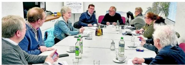
Produktiv und kreativ: Die beiden Gremien aus Borne und Rheine trafen sich zum Planungsgespräch im Rathauszentrum.

Den Auftakt macht ein Besuch der Traditionsveranstaltung „Borne op z'n Best“ am 11. April. Vor allem wegen des landesweiten Wettbewerbs der „Living Statues“ erregt sich diese Veranstaltung großer Beliebtheit. Aber auch das Musikprogramm, kulturelle Angebote und der verkaufsoffene Sonntag locken ausende Menschen nach Borne. Der Städtepartnerschaftsverein Rheine wird wieder einen Bus ansetzen, einnehmen könnten alle interessierten Bürgerinnen und Bürger. Die Gruppe aus Rheine wird diesmal im Kulturhaus mit einem Kaffeetrinken begrüßt. Danach können die Besucher individuell durch Borne bummeln. Für