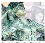
Die „Living Statues“ in Borne: Zwei Dutzend dieser sehr kreativen Kunst-Acts sind Ende April bei „Borne op z'n Best“ zu sehen.

Im Juni findet auf Einladung der Senioren Herz-Jesu eine ganztägige Fahrradtour im Raum Rheine statt. Die