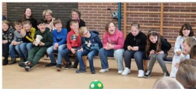
HERTME Donderdag 16 april was het eindelijk weer zo ver. Na de corona jaren weer een scholenuitwisseling waarbij groep 5/6 van de St.Aegidius in Hertme kinderen konden ontmoeten en leren kennen uit Rheine.

De bus uit Rheine werd bij aankomst in Hertme op het schoolplein ontvangen met een luid applaus, een warm welkom voor de kinderen uit Rheine na regenbuien en een korte „Stau“ onderweg.